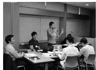
前期合宿での講義の様子