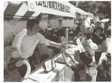
▲第89回メーデーの様子