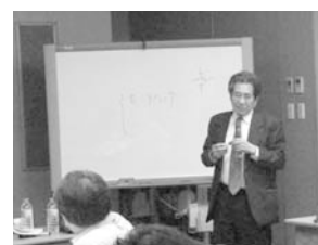
現代福祉論について論じる高木日本女子大学名誉教授