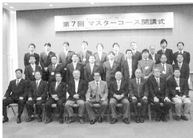
第7回マスターコース受講生の皆さん

講義は、「ニュー連合の役割・行動Ⅰ－自分の役割・行動」を皮切りに、以下のプログラムで進められました。各講義では、ゼミごとのグループディスカッションと発表を組み入れながら、全体で活発な討議・意見交換を行いました。