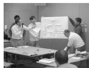
グループ発表の風景